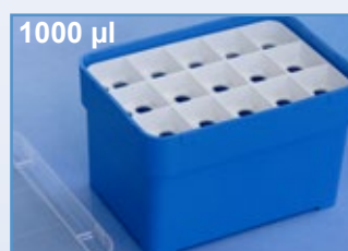
Kat.-Nr.: 974 290