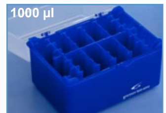
Kat.-Nr.: 941 320