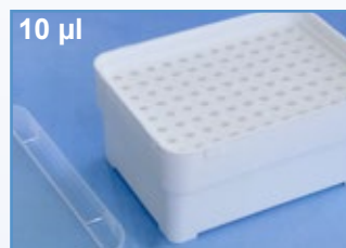
Kat.-Nr.: 973 276