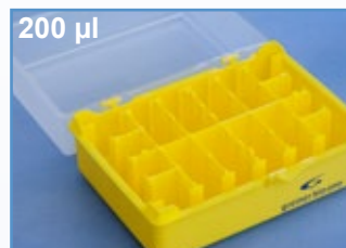
Kat.-Nr.: 941 310