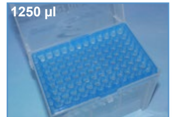
Kat.-Nr.: 970 350