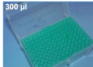
Kat.-Nr.: 970 330