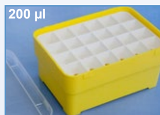
Kat.-Nr.: 973 270