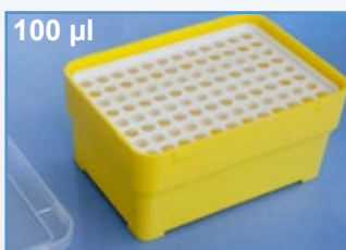
Kat.-Nr.: 973 202