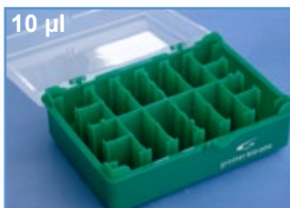
Kat.-Nr.: 941 300