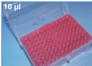
Kat.-Nr.: 970 310