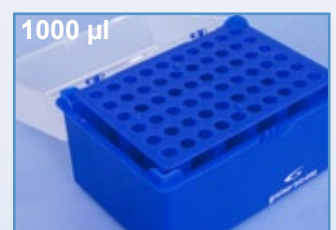
Kat.-Nr.: 941 325

Für weitere Informationen und/oder Musterbestellungen besuchen Sie unsere Webseite www.gbo.com oder sprechen Sie uns an: