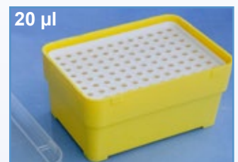
Kat.-Nr.: 973 272