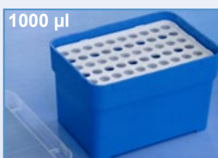
Kat.-Nr.: 974 280