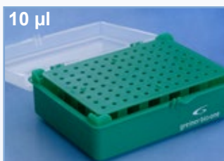
Kat.-Nr.: 941 305