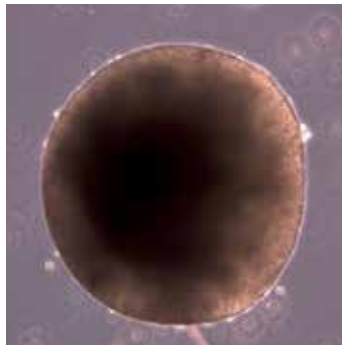
Abbildung 2: iPSC-Stammzellenaggregat