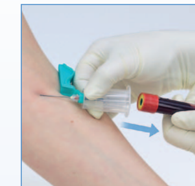
6 Abziehen des Röhrchens