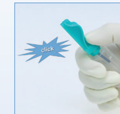
8 Hörbares Klicken beim Einrasten