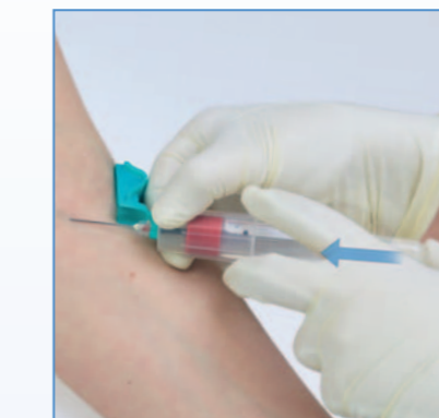
5 Einsetzen des Röhrchens