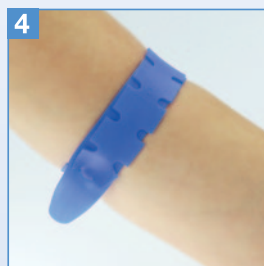
4 Der Venenstauer ist in dieser Position fixiert.