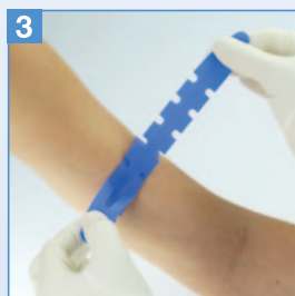
3 Festziehen bis die nötige Spannung erreicht ist.