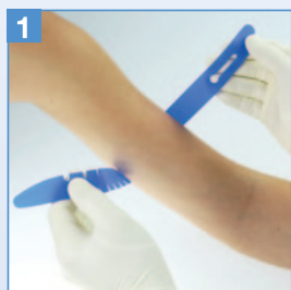
1 Venenstauer in Position bringen.

Die vollständigen Handhabungshinweise finden Sie in der Gebrauchsanweisung unter www.gbo.com .