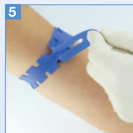
5 Am kürzeren Ende ziehen, um ihn zu lösen.