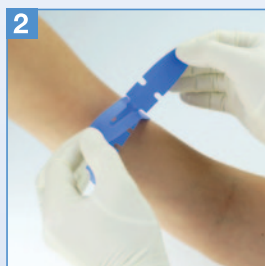
2 Das gegenüberliegende Ende durch den Schlitz ziehen.