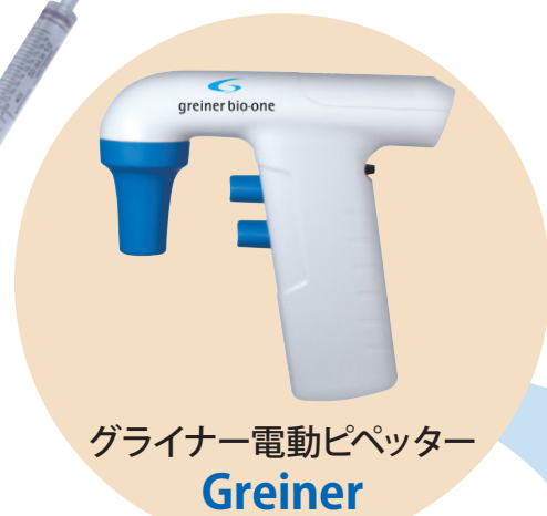
グライナー電動ピペッター Greiner Sapphire-Maxipette