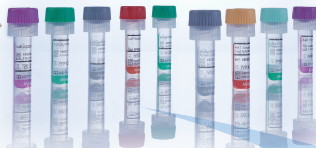
販売名「ミニコレクトII」 一般的名称「開放型採血用チューブ」 医療機器認証番号 229 AABZX 00018000