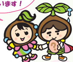
ファスマック花子 ファスマック太郎 ファスマック公式マスコット

アンチセンス医薬品、 分子生物学研究用試薬、 臨床診断薬など、 様々な応用研究で 注目されています！