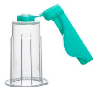
VACUETTE® QUICKSHIELD Sicherheitsröhrchenhalter

** vormontiert mit VACUETTE® VISIO PLUS Kanüle