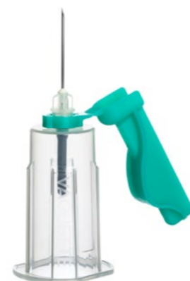
VACUETTE® QUICKSHIELD Complete PLUS

Das einzeln verpackte Produkt steht ohne weitere Arbeitsschritte für den sofortigen Einsatz bereit.