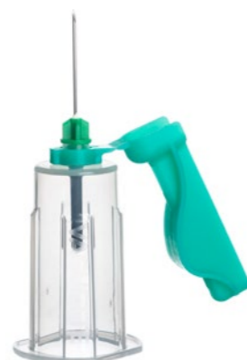
VACUETTE® QUICKSHIELD Complete

Der Halter kann mit VACUETTE® Mehrfachentnahmekanülen oder mit VACUETTE® VISIO PLUS Kanülen verwendet werden.