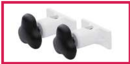
ACC 537 Jeu d'étaux diam. 14mm pour gouttières et étriers pour toutes gammes sauf LUVIA