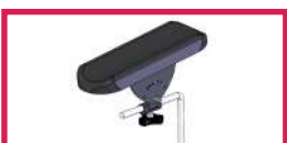
ACC 110POLY Gouttière prise de sang polyuréthane avec ferrure Sans étau, l'unité