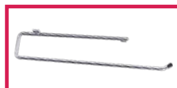
ACC 125 Porte rouleau adaptable tous modèles