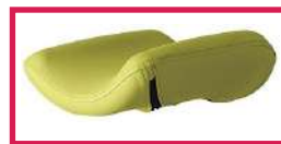
SLFEMIREPOSE Housse prélude pour repose jambes (ACC964), l'unité