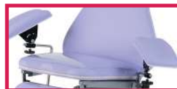
ACC 514-ASSISE Protection plastique assise