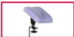
ACC 514-GOUT Protection gouttière en plastique transparent, l'unité