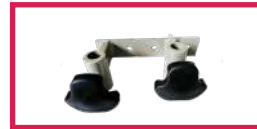
ACC 535 Jeu d'étaux double diam. 14mm et 16mm pour gouttière + tige porte-sérum