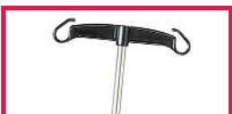
ACC 32012 Tige porte-sérum inox diam. 16mm, 2 crochets plastiques, sans étau