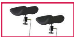
ACC 964 Jeu de repose jambes noir, sur rotule mousse polyuréthane, diam. 14mm, sans étau