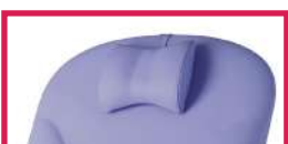
ACC TETERGO Tête ergonomique amovible