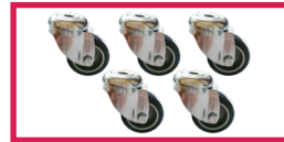
ACCROULETTE-02 5 roulettes simple galet diam. 50mm