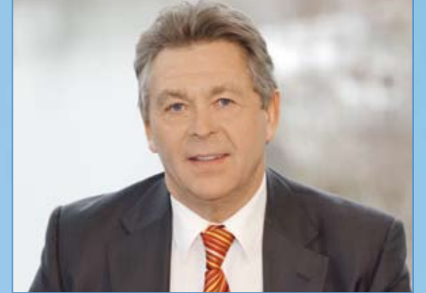
Ing. Franz Konrad (Greiner Bio-One CEO)

The challenges on the market are highly demanding and constantly on the increase. We concentrate our resources on innovative products with high potential for growth . Besides future trends, our existing product portfolio – in particular the realisation of further DNA arrays and the launch of a new generation of safety products for specimen collection – have excellent perspectives.