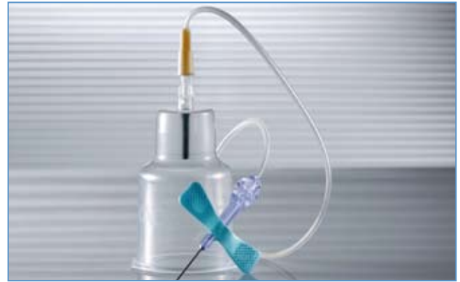
Geeignet für BacT/Alert and BacTec Blutkulturflaschen

Das Sicherheitsblutentnahmeset mit bereits vormontiertem Halter wurde speziell für die in einem Arbeitsschritt durchführbare Entnahme mit gängigen Blutkulturflaschen sowie VACUETTE® Blutentnehmeröhrchen entwickelt. Für die einfache Verwendung wird das Set steril sowie in bereits gebrauchsfertigem Zustand angeboten. Durch die flexible Verwendung wird die Anzahl der Entnahmen reduziert und somit eine kostengünstige und patientenschonende Arbeitsweise unterstützt. Um allen Ansprüchen gerecht zu werden, gibt es den Blutkulturflaschenhalter auch mit Standardblutentnahmeset ohne Sicherheitsmechanismus.